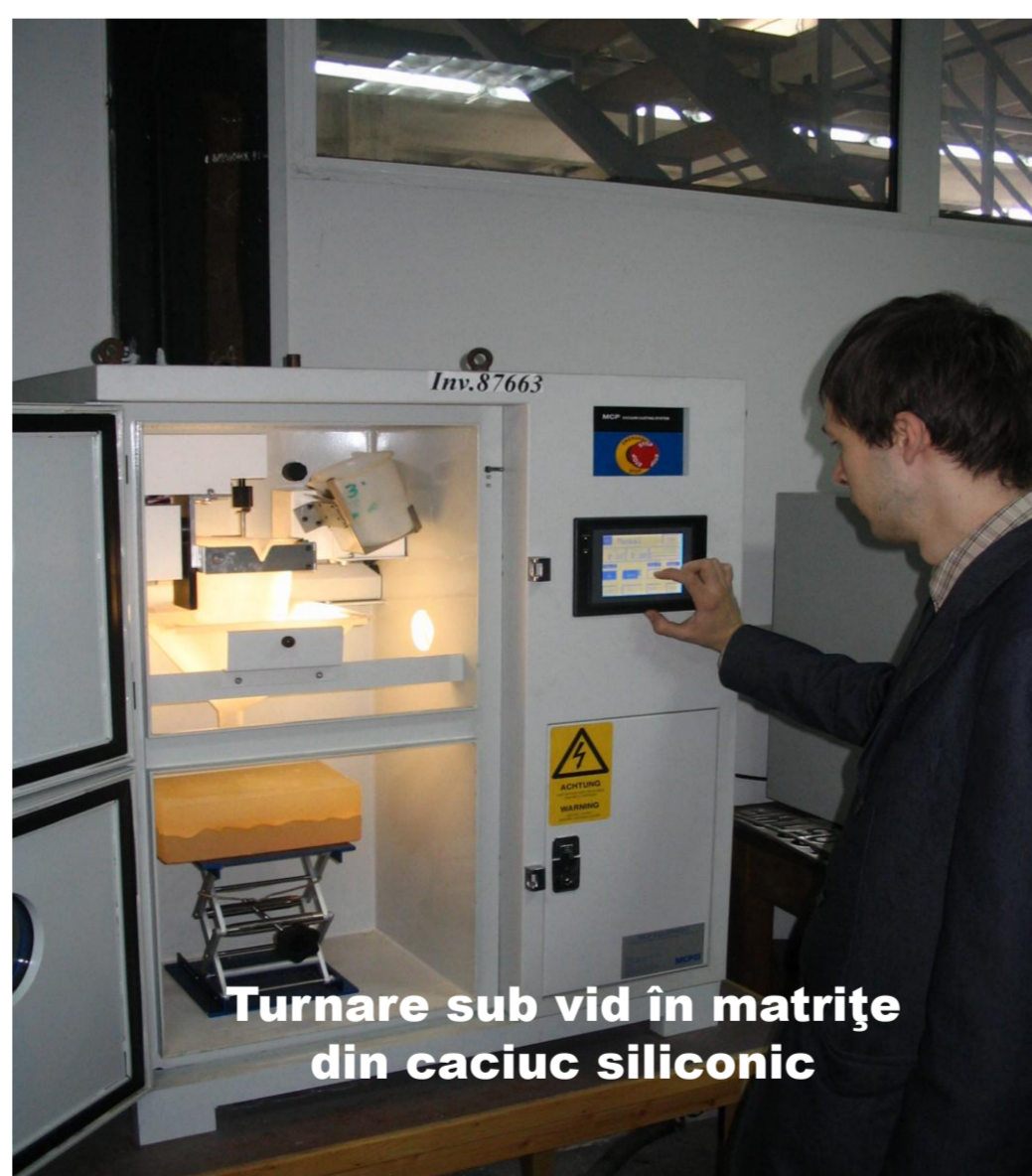
Turnare sub vid în matrițe din caciuc siliconic