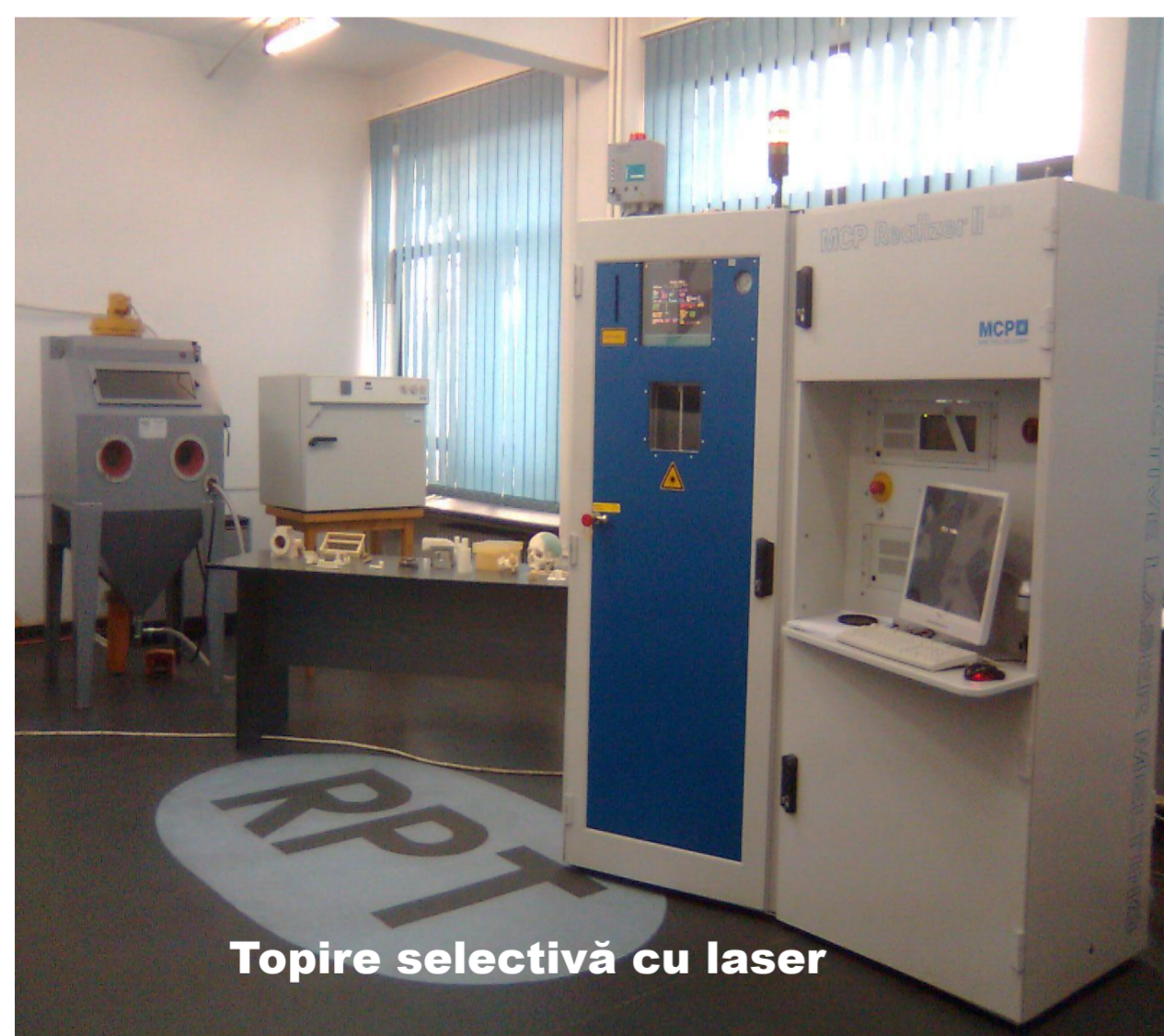
Topire selectivă cu laser